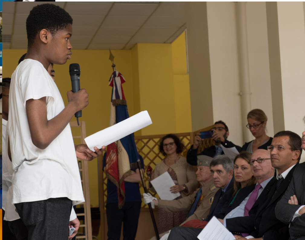
Prises de parole d'élèves lors de cérémonies de dépôts de drapeaux à Boris Vian (Paris) et Raoul Dufy (Lyon).